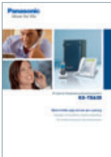
Broschüre Telekommunikations- system KX-TDA30