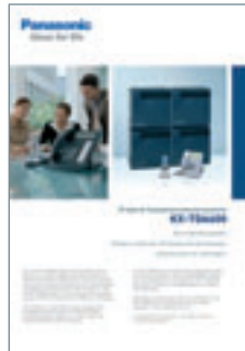
Produktblatt Telekommunikations- system KX-TDA600