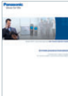
Broschüre Mobile DECT- Systemendgeräte