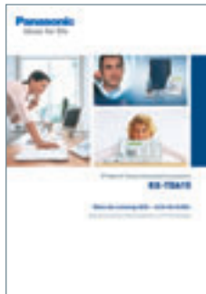
Broschüre Telekommunikations- system KX-TDA15

Informationen auch im Internet: www.tda.panasonic.de