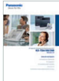
Broschüre Telekommunikations- system KX-TDA100/200