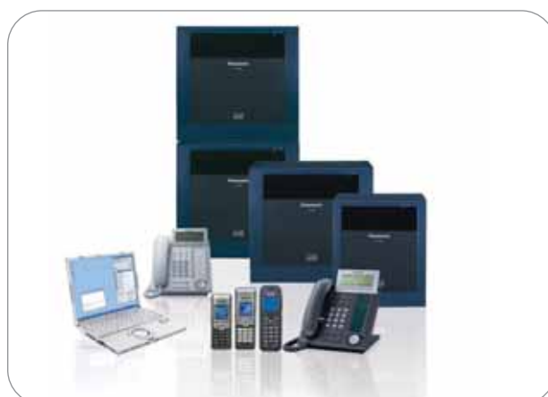
DIE KOMMUNIKATIONSPLATTFORMEN DER KX-TDE-SERIE

Konvergent, modular, erweiterbar, flexibel SIP-aktiviert und mit integrierter Unterstützung für Unified Communications-Produktivitätsanwendungen. Diese Attribute machen die KX-TDE-Serie zur optimalen Kommunikationsplattform für Kunden, um ihre heutigen und zukünftigen Geschäftskommunikationsanforderungen zu erfüllen, da sie Unified Communications mit umfassender IP-Telefonie vereinen. Diese Systeme wurden für einfache Installation und kostengünstigen Betrieb entwickelt und bieten dadurch einen schnellen ROI.