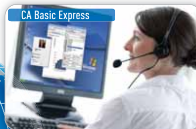
CA Basic Express