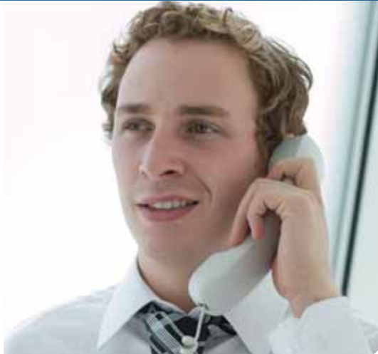
BROSCHÜRE ZU KX-TDE100/200/600