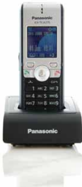
KX-TCA275 Kompaktes Business-DECT