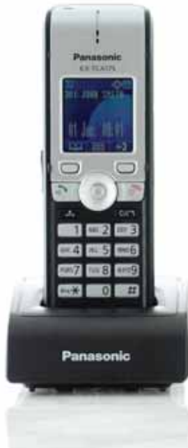
KX-TCA175 Standard- Business-DECT