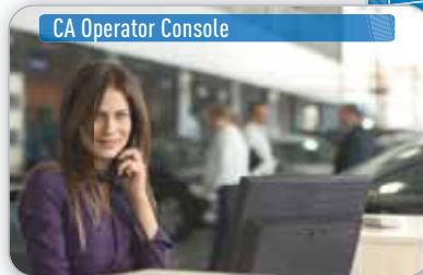
CA Operator Console

EMPFANGSMITARBEITER, DER KUNDENANRÜFE ENTGEGENNIMMT UND WEITERLEITET