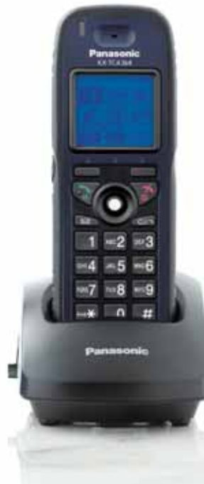
KX-TCA364 Robustes Business-DECT